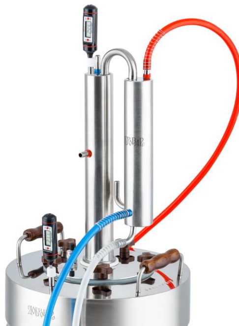
Рис. 2. Подключение аппарата в режиме дистилляции