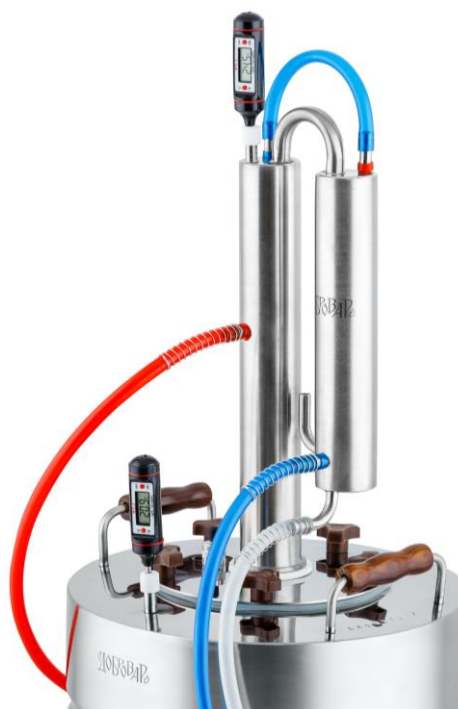
Рис. 3. Подключение аппарата в режиме укрепления